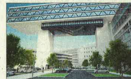
An eine Vision des russischen Architekten El Lissitzky knüpft die „Medienbrücke“ an. Er hatte von auf Pfeilern liegenden Häusern geträumt.

um die Medienbrücke München „sehr lebendig“ wird, könnte schon bald in Erfüllung gehen. Sie soll laut der Planungen der IVG Development und ihrer Projektpartner „ein richtungsweisendes Projekt