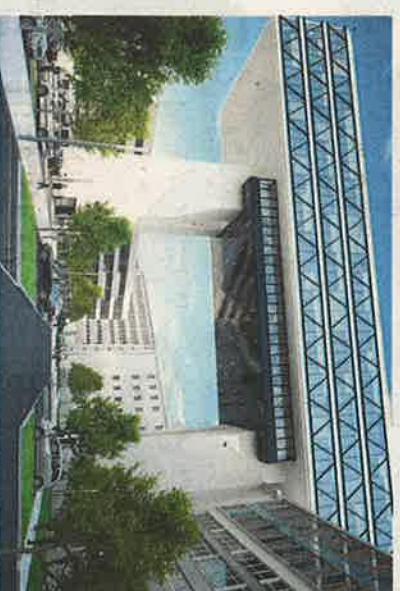
Am Boden kann ein offener Hofbereich mit Park und Parkplätzen angelegt werden.

Erdgeschossbereich eine urbane Nutzung, die auch auf die angesiedelten Unternehmen anregend wirken könne. Zusammen mit den umliegenden Gebäuden an der Rosenheimer Straße 145 entwickle sich hier ein wahrer „Cluster für die Medienstadt München“, sagt Ude. Schließ-