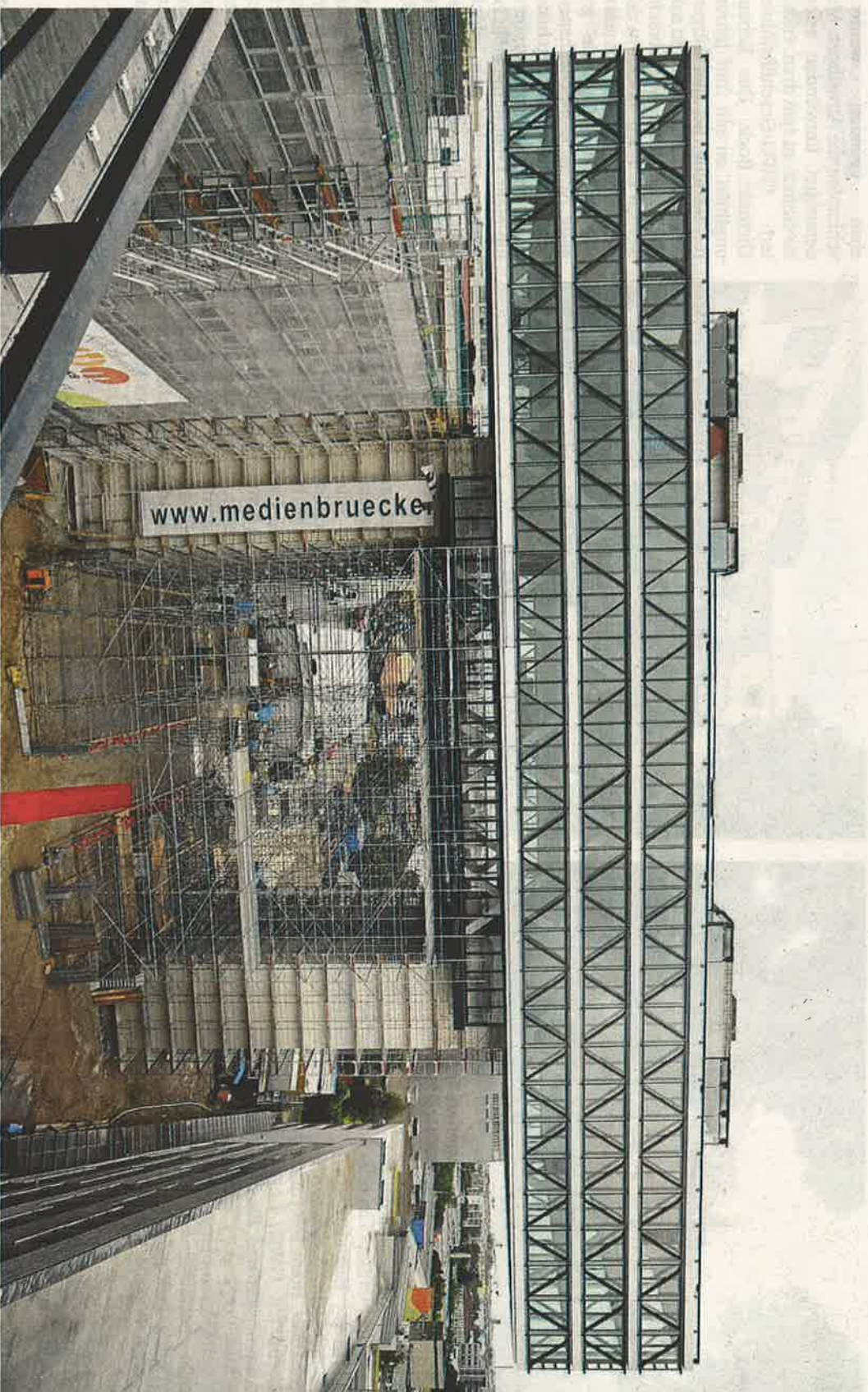
Ein spektakuläres Projekt: Die Medienbrücke München an der Rosenheimer Straße liegt in luftiger Höhe.