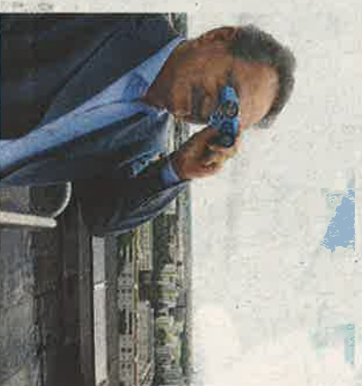
Über den Dingen: Von oben hat nicht nur der OB einen guten Ausblick.